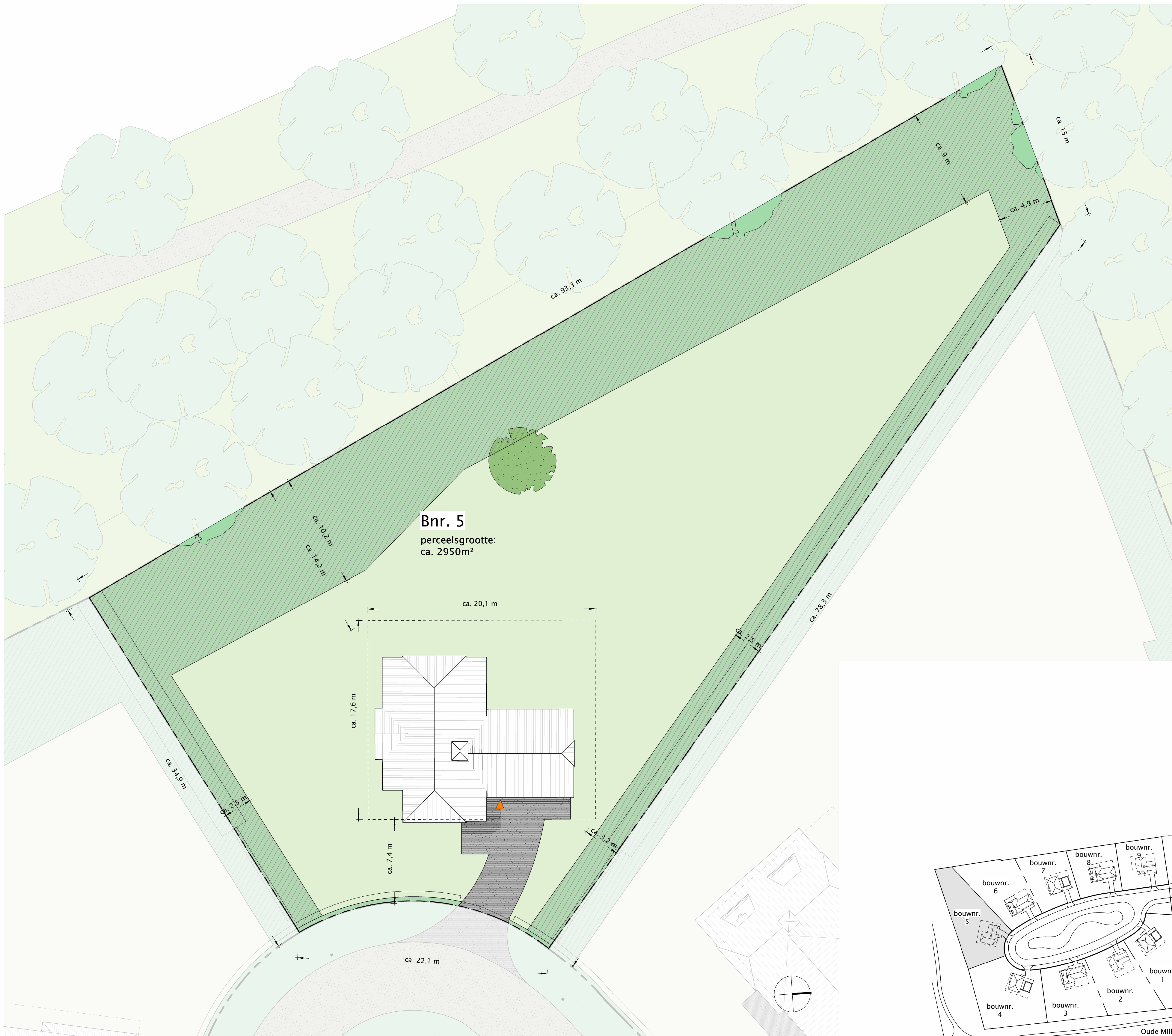
kavel bouwnummer 5 1 : 200